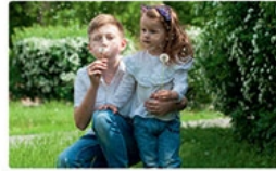
brother and sister [brader end syster]