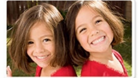
twin sisters [tijn systers]