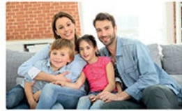
mum and dad [mam end ded]