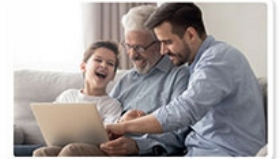
dad and daughter [ded end doter]