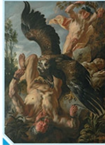
Prometeusz w okowach, Jacob Jordaens (ok. 1640)