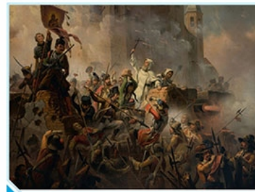
Obrona Jasnej Góry 1655, Janusz Suchodolski (XIX wiek)