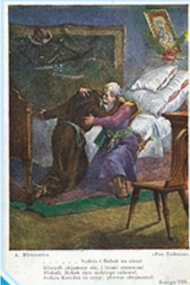
Sędzia i Kujdźz Robak, reprodukcja grafiki Michała Elwira Andriolego, pocztówka (1938)