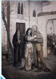
Powitanie ojca przez Recha, Maurycy Gottlieb (1867–1877)