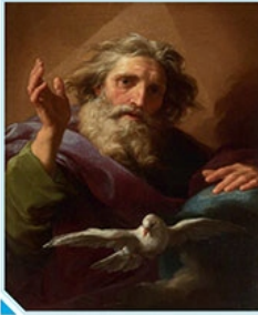
Bóg Ojciec i Duch Święty, Pompeo Batoni (1740–1743)