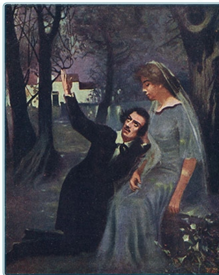
Pocztówka do wydania Kordiana , autor nieznamy, ok. 1930 r.