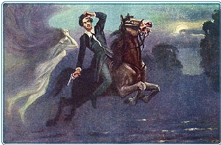
Pocztówka do wydania Kordiana , autor nieznany, ok. 1921 r.